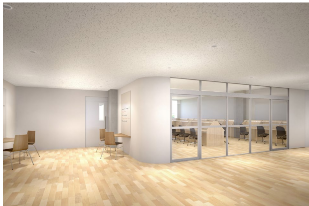
▲3階に設置される明るく清潔な自習室（右）と多目的ホール（左）。