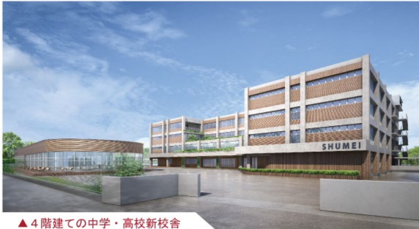
▲ 4階建ての中学・高校新校舎