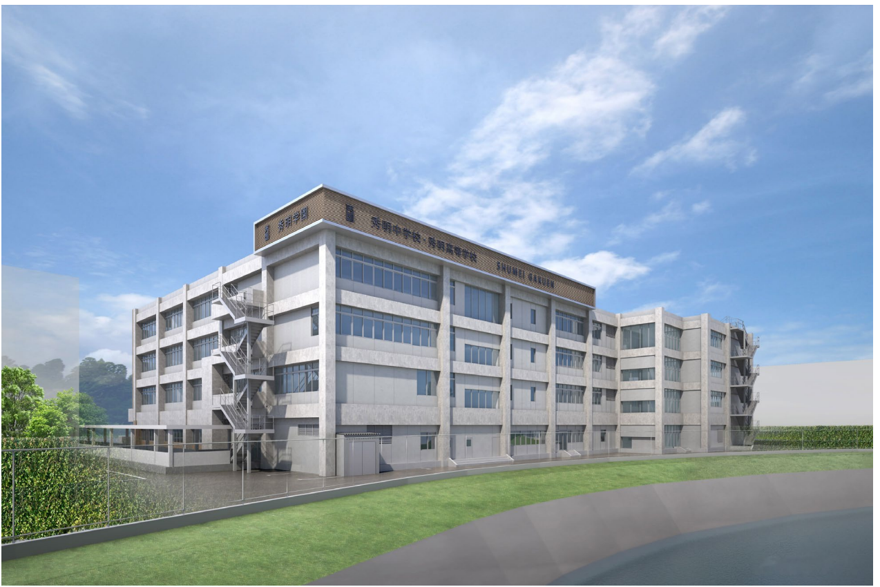
▲北側（小畔川側）から見た新校舎。新校舎は中高合同で地上4階建てとなり、旧高校校舎より広い敷地に建設されます。