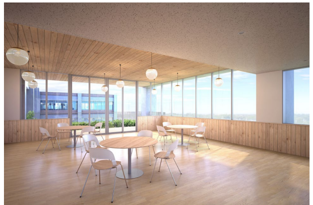
▲4階のテラスに面して設置されるイングリッシュサロンは、英語教育に活用。