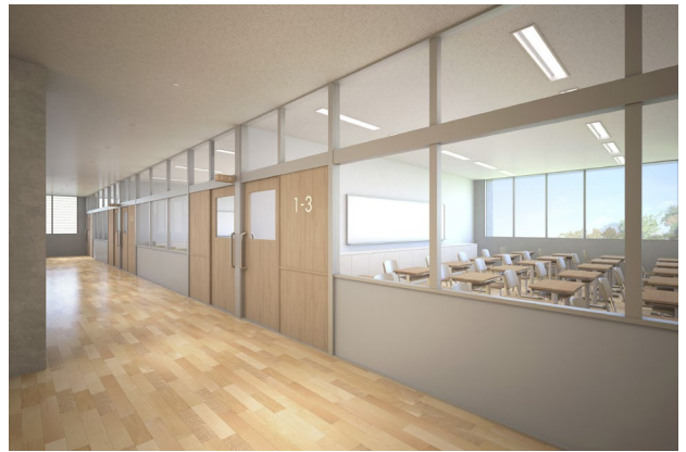
▲タブレットや電子黒板などに対応するため、全教室でWiFiアクセスが可能。