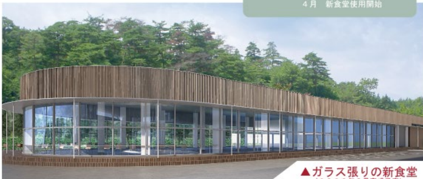
▲ ガラス張りの新食堂 (2026年3月完成予定)